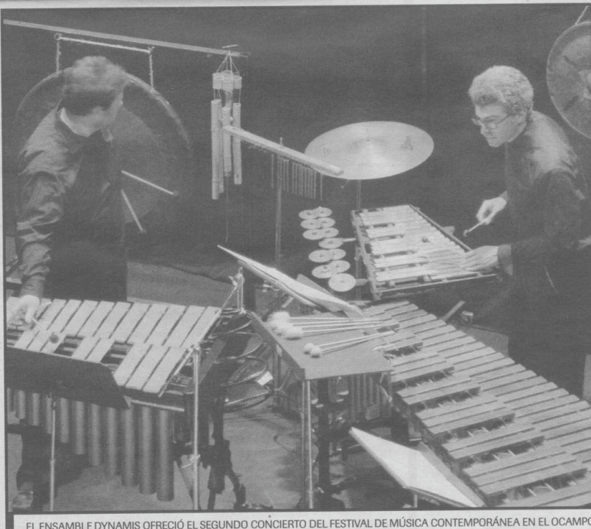
EL ENSAMBLE DYNAMIS OFRECIÓ EL SEGUNDO CONCIERTO DEL FESTIVAL DE MÚSICA CONTEMPORÁNEA EN EL OCAMPO.

musical, entregada en tres movimientos (Jeu des étoiles, Interludio, Y ahora mi paracaídas cae de sueño en sueño por los espacios de la muerte), el conjunto se ajustó a las necesidades de la siguiente obra: "La Valse", de Maurice Ravel, únicamente para dos pianos, en la que los intérpretes resaltaron la extrema elegancia e ironía de tal pieza, que agitó las fibras de los melómanos.