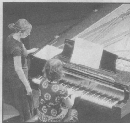
EL ENSAMBLE ITALIANO DELEITÓ A LOS ASISTENTES.