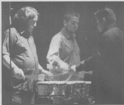
CONCLUYEN CON LA OBRA "DRUMMING", DE STEVE REICH.