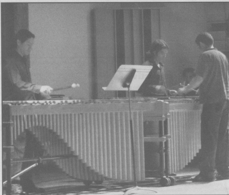
CON LA PARTICIPACIÓN DEL ENSAMBLE DE PERCUSIONES DEL CONSERVATORIO DE LAS ROSAS CONCLUYÓ EL IV FIMCM.

El cierre del programa estuvo a cargo del Ensemble de Percusiones del Conservatorio de las Rosas con la obra "Drumming" de Steve Reich (1936), compositor neoyorquino considerado pionero