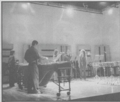
DURANTE LA INTERVENCIÓN DEL ENSAMBLE DE PERCUSIONES.